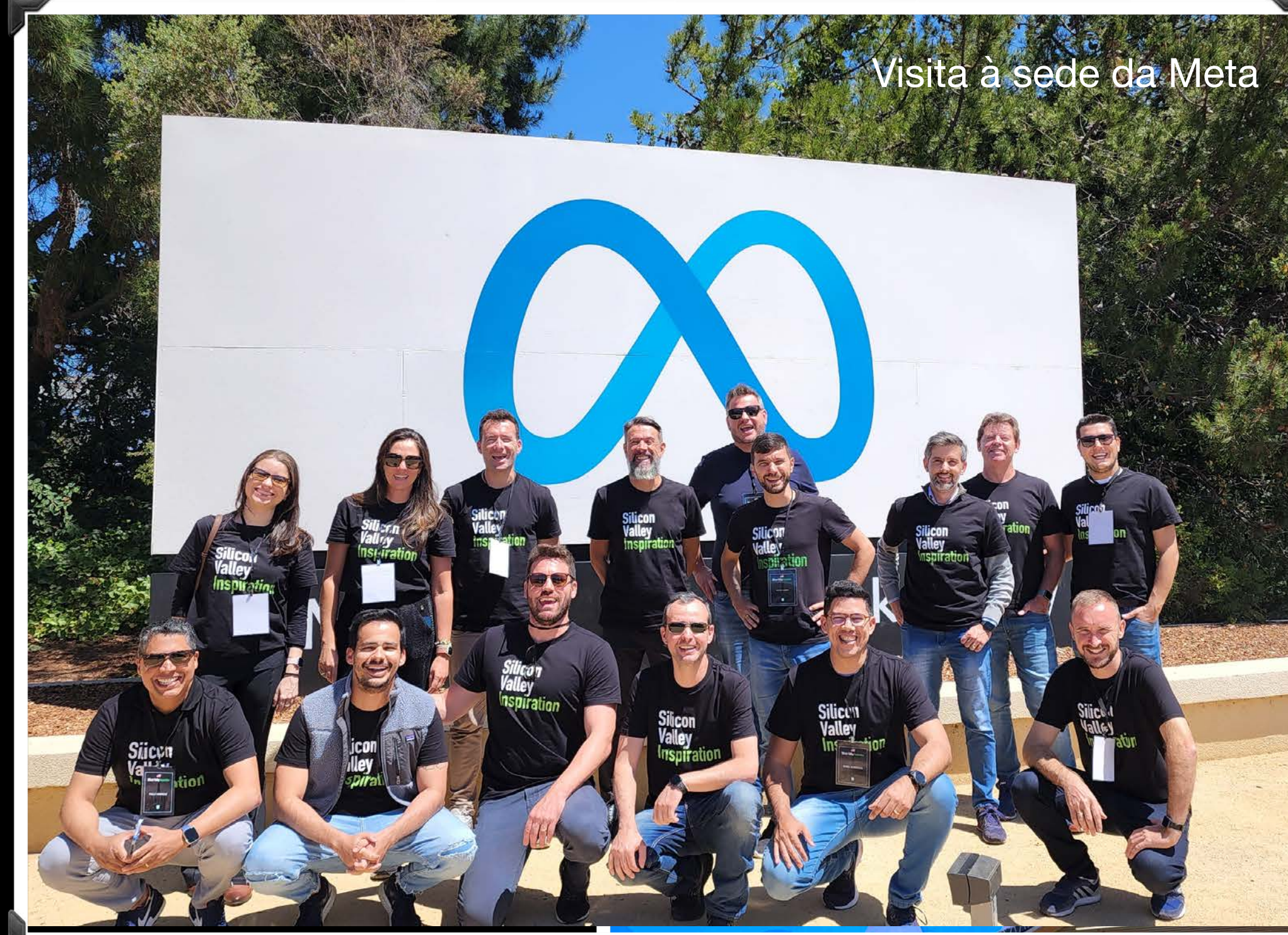
Visita à sede da Meta