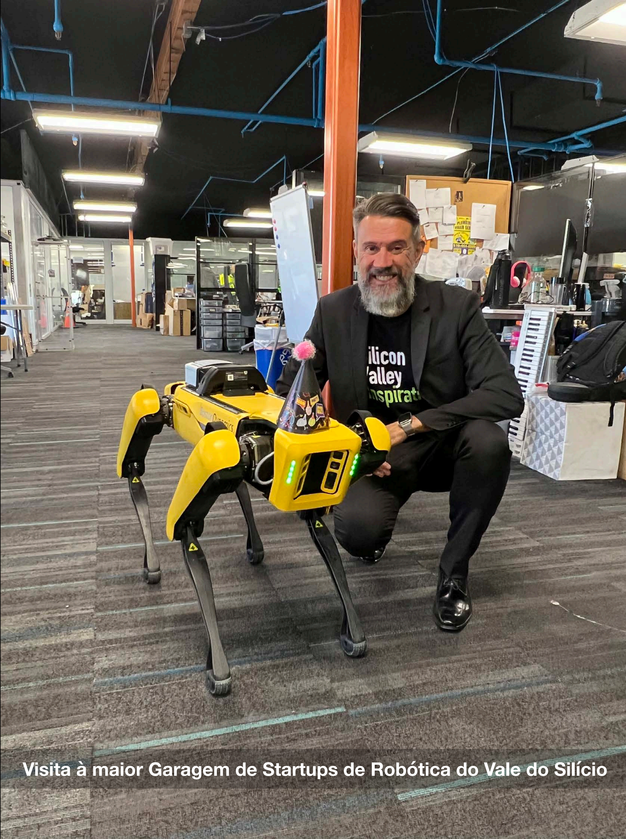
Visita à maior Garagem de Startups de Robótica do Vale do Silício