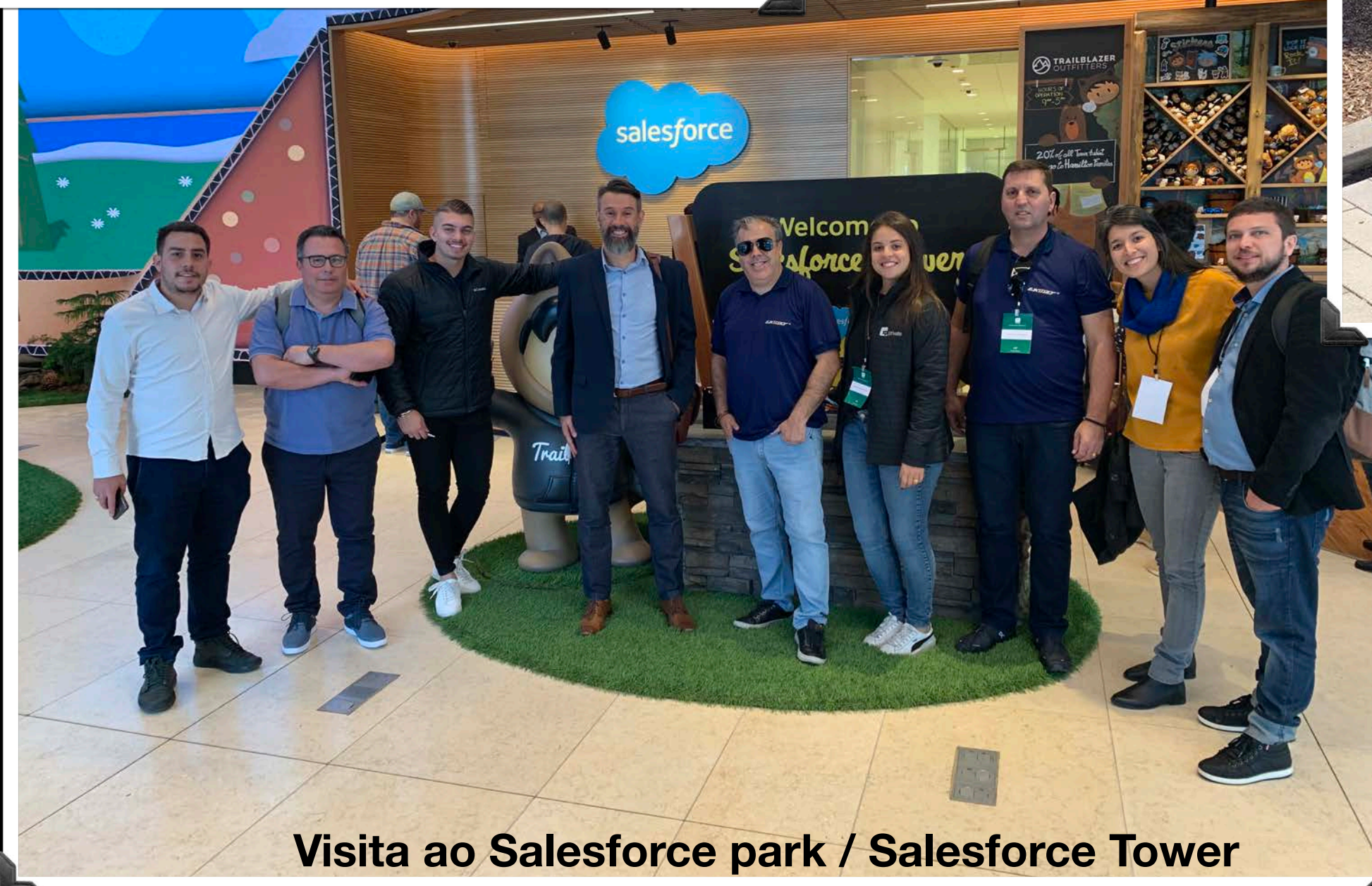
Visita ao Salesforce park / Salesforce Tower