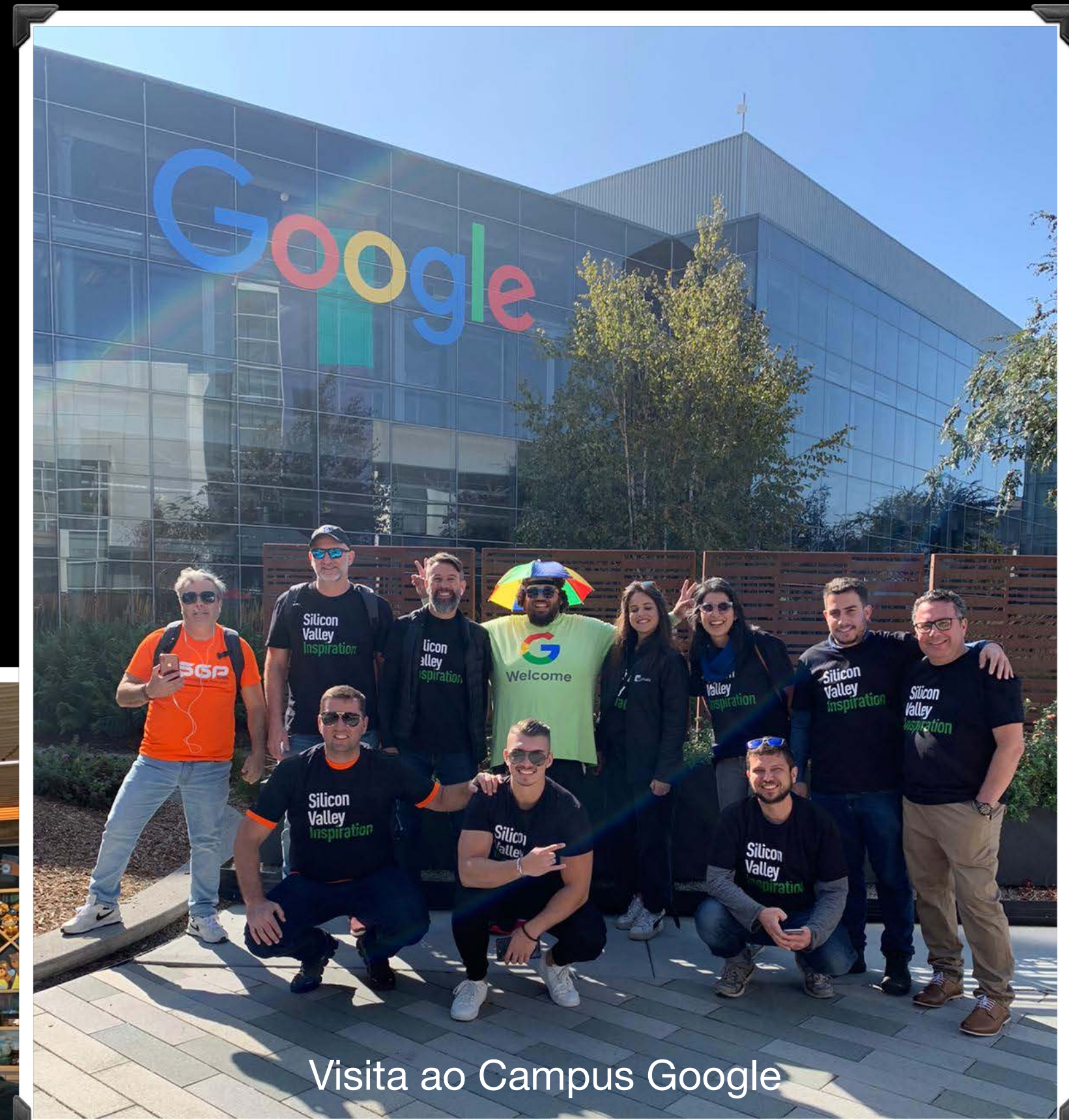
Visita ao Campus Google